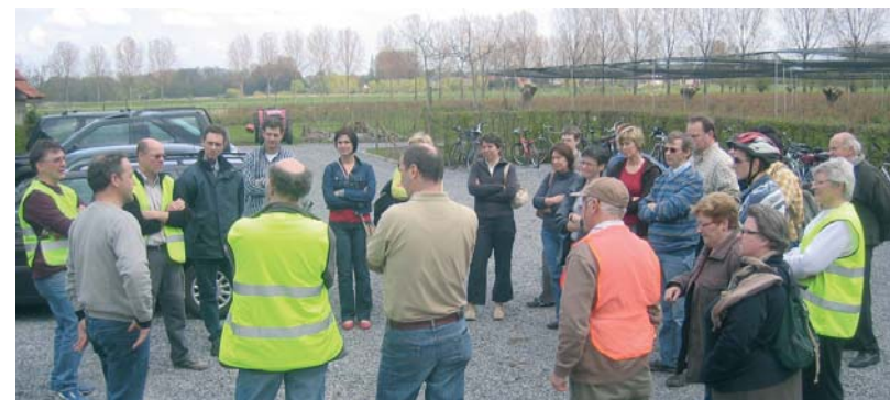
Fietstocht "Dag v/d aarde" Bezoek aan de zelfpluktuin "Pur Fruit" te Oeselgem.

Nu de eerste en plechtige communiefeesten of lentefeesten voorbij zijn (proficiat aan alle gevierden), nodigen we u terug uit naar enkele activiteiten van onze gezinsbond: