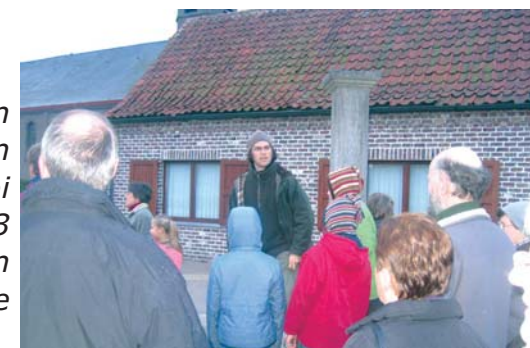
Eerste halte van de ochtendwandeling (13 april) aan de schandpaal op kerkplein van Zeveren.

We mochten genieten van twee boeiende activiteiten in april, telkens met mooi weer: ochtendwandeling 13 mei (25 deelnemers) en fietstocht t.g.v. "dag van de aarde" 20 april (125 pers.).