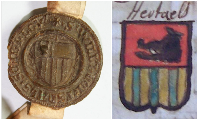
Figuur 2: zegel van Willem Herthals, schepen van Leuven anno 1362 (links) en van de familie Herthals begin 18 de eeuw (rechts)

In 1362 wordt, zoals hoger vermeld, een Willem Herthals (#1) vernoemd als schepen van Leuven. Willem Herthals verzegelde zijn stukken van een zegel die bewaard is gebleven en te vinden is in het Stadsarchief van Leuven.