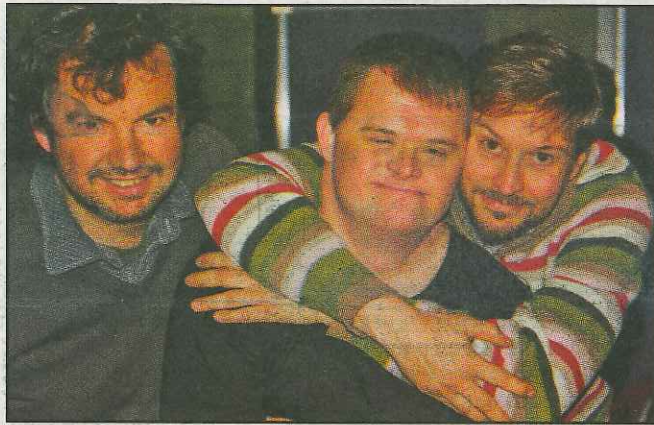
Willem (regisseur), Tony (acteur) en Paul (scenograaf).