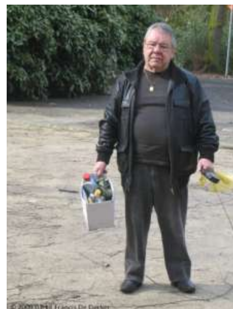
Burenen ruimen de rotzooi op, die jongeren 's nachts achterlaten in het park

Wij hebben geregeld contacten met de politie over deze problematiek, en ook op de zitdagen van de zonechef is dit een steeds weerkerend thema. Laatst hebben wij op onze website richtlijnen geplaatst om tegen deze overlast effectief op te treden. Ik denk dat wij de medewerking van alle burenen nodig