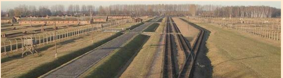
Auschwitz-Birkenau, het uitroeiingskamp gezien vanuit de hoofdcontrolepost boven de dodenpoort.

Het Transport XX wordt begeleid door een commando van de Schutzpolizei dat speciaal uit Duitsland werd overgebracht. Het bestaat uit een officier en 40 manschappen. Ondanks deze bewaking slaagt Robert Maistriau erin één treinwagon te openen. Zeventien mensen wagen het te vluchten. Terwijl de trein verder rijdt, kunnen nog tientallen gedeporteerden ontsnappen uit andere treinwagons. Zagen, vijlen, tangen en ander materiaal dat verstopt werd in het stro, maken het mogelijk enkele treinwagons van binnenuit te openen. In het totaal kunnen 232 personen ontsnappen uit dit transport – 87 gedeporteerden worden terug gevat en op een volgend transport gezet – 26 gevluchte personen worden gedood en 119 gedeporteerden slagen in hun ontsnapping. De jongste vluchteling is amper elf jaar en heet Simon Gronowski. Ook Regine Krochmal, een achttienjarige verpleegster uit het verzet, zal kunnen ontvluchten. Met een broodmes zaagt ze de houten stangen door die voor het verluchtingsgat zijn aangebracht. Ze springt uit de rijdende trein even vooraleer hij tot stilstand wordt gedwongen. Beide personen hebben de oorlog overleefd.