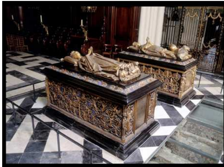
Praaigraven van Karel en zijn dochter Maria in de O.-L.-Vrouwekerk, Brugge.