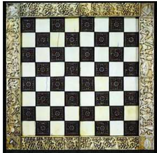
Schaakbord met bewerkte ivoren rand

Een persoonlijke keuze maken uit het geheel, is bijna onmogelijk. In een vitrine werd ik geconfronteerd met een replica van een overdadig met parels en juwelen overdekte gouden hertogshoed van Karel de Stoute. Tegen de wand daarachter: tekeningen die voor de Fuggers waren gemaakt in 1504, toen de stad Bazel heimelijk een aantal voorwerpen aan hen verkocht. Een ervan, cat. nr. 97, bezorgde me een schok. Het geeft een onwerkelijk gevoel, wanneer je in de realiteit een voorwerp ontmoet, dat je vertrouwd is uit de fictie van een roman!