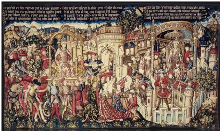
Caesar-tapijt, uit een serie van vier. Nederlanden ca. 1450-1470, wol en zijde, 430 x 730 cm

Geen van beide doelstellingen zou hij bereiken. Zijn eerste regeringsjaren waren succesrijk, doch in 1473 keerden zijn kansen na een ontmoeting met de Duitse keizer Frederik III in Trier. Daar stelde de hertog een huwelijk voor tussen zijn dochter, Maria van Bourgondië, en de zoon van de keizer, Maximiliaan van Oostenrijk. Maar Karel stelde eisen die de keizer niet zinden en etaleerde zijn rijkdom al te opzichtig. Met averechts effect ditmaal: de keizer poetsde de plaat als een dief in de nacht. Bijna zeker speelde ook Karels eeuwige vijand, Lodewijk XI van Frankrijk, 'de Spin', achter de schermen een nefaste rol.