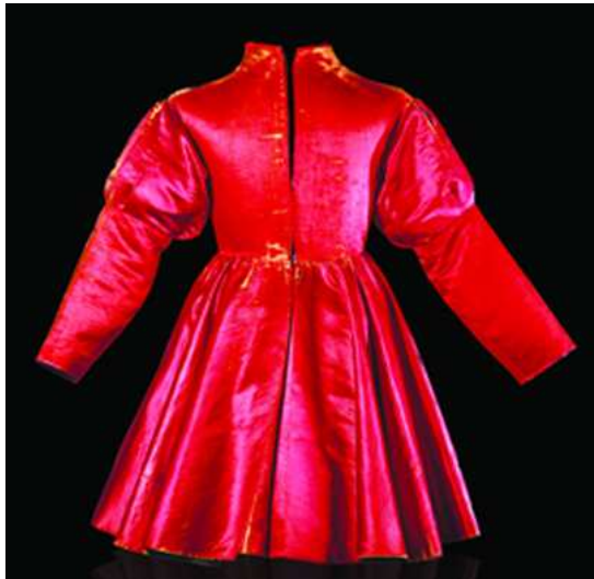
Rode tuniek uit zijdesatijn, het enige bewaarde mannelijke burgerlijke kledingsstuk uit de 15 de eeuw. (Bern, Historisches Museum)

om de Bourgondische hertogen op het toppunt van hun macht zo'n overweldigende indruk maakten in Europa.