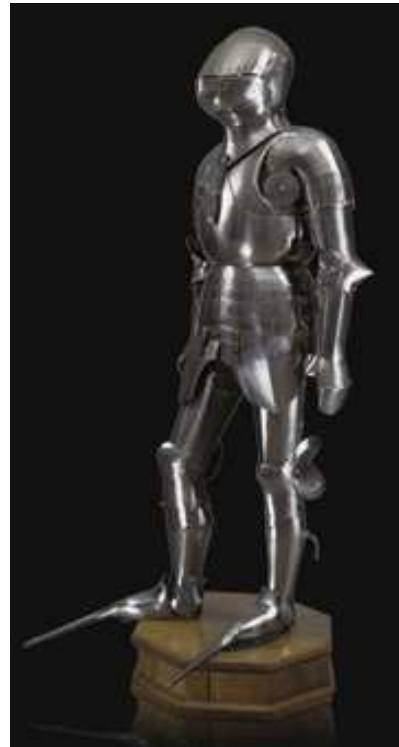
Harnas van Frederik van de Pfalz (Kunsthistorisches Museum Wien)

De hertog was voortdurend op reis in zijn gebieden om recht te spreken, oorlog te voeren of om het bestuur te regelen. De laatste twee jaar van zijn leven woonde hij in tentenkampen. Op die reizen nam hij een groot deel van zijn pronkstukken mee en waar hij verbleef, liet hij ze uitstallen. Door die gewoonte kwam het dat de Zwitserse Eedgenoten, na hun overwinning in Grandson, de hand wisten te leggen op een buit die tot de belangrijkste uit de geschiedenis behoort. Een selectie uit die Burgunderbeute, bewaard in het Historisches Museum van Bern, is op de tentoonstelling te zien. De kwaliteit is werkelijk adembenemend. Er hangt bijvoorbeeld een millefleur-wandtapijt met het wapen van Filips de Goede waarop dertig verschillende soorten bloemen en planten in bloei staan. Dergelijke tapijten waren statussymbolen bij uitstek, niet alleen door het overvloedige gebruik van zijde, goud- en zilverdraad, maar ook omdat het maanden werk kostte om een zo gecompliceerde voorstelling te realiseren.