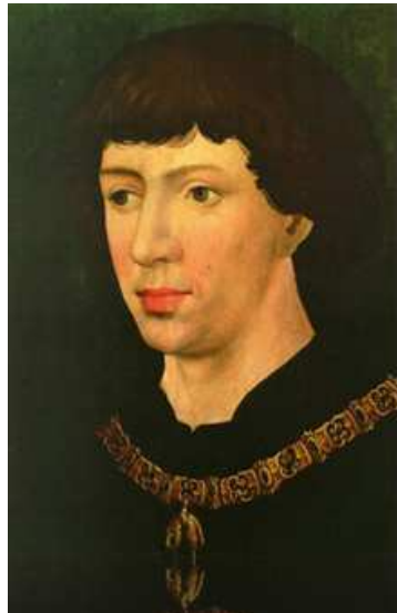
Rogier van der Weyden portret van Karel de Stoute. (Kunsthistorisches Museum Wien)

Van 27 maart tot 21 juli 2009 loopt nu in het Groeningemuseum in Brugge een toptentoonstelling die focust op de Bourgondische hertog Karel de Stoute (1433-1477) en het schitterende hof waarmee hij zijn tijdgenoten verbluifte. Karels pronkstukken, die na zijn nederlaag in Grandson door de Zwitsers werden buitgemaakt, vormen het hart van de expositie. Het is de eerste keer dat deze legendarische ' Burgunderbeute ' het Zwitserse grondgebied verlaat, om even naar huis terug te keren. Ook het Weense Kunsthistorisches Museum leende topwerken uit. Voor Brugge was de tentoonstelling te zien in Bern (met veel succes), na Brugge gaat ze naar Wenen. Alle pancartes met uitleg zijn in vier talen: Nederlands, Frans, Duits en Engels (en vermelden telkens de herkomst van de voorwerpen: zeer verhelderend soms). Een hoffelijke geste jegens anderstalige bezoekers, waaraan veel wereldberoemde musea voor mijn part een puntje mogen zuigen!