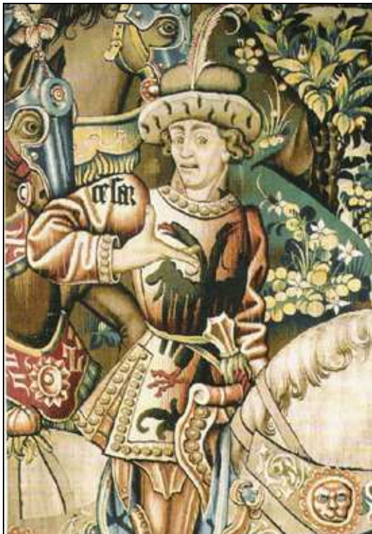
Detail van het derde Caesar-tapijt. Caesar trekt over de Rubicon. Merk de Duitse keizerlijke dubbele adelaar op zijn borst en zijn naam op zijn rechterschouder. Hij draagt een hoed met pluim die lijkt op de hertogshoed van Karel de Stoute hier onder

Hun invloed kun je vergelijken met het gedrag van hedendaagse fans van Elvis Presley of Michael Jackson of de voetballer David Beckham of, nog erger, Paris Hilton of een andere leeghoofdige producente van gebakken lucht. En die hun idool in alles proberen te imiteren, tot in kleding en danspasjes toe! Vandaar het gevaar van de graatmagere skeletten op de catwalk, die leiden tot het succes van websites die anorexia promoten ... en tot jonge navolgers die lijden en sterven aan die ziekte.