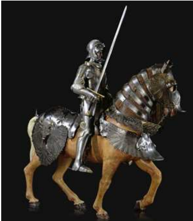
Paarden- en ruitersharnas. (Kunsthistorisches Museum Wien)