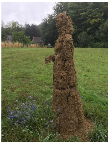
Hetzelfde beeld 3 maand later 'vergaan' door regen en wind... en een bloementapijt