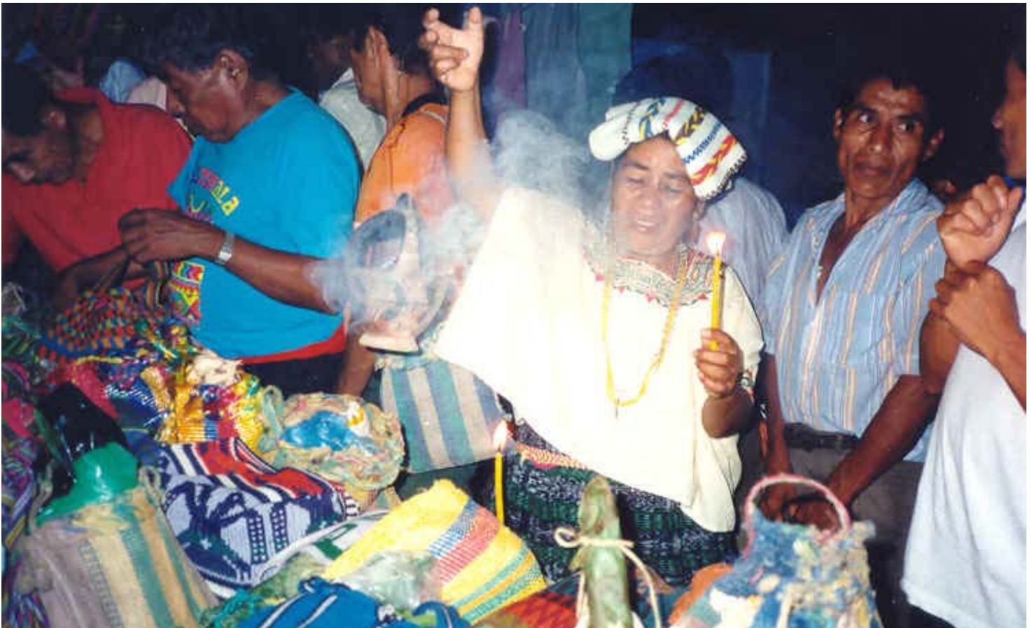
Mayavrouw zegent de maïskorrels met wierook en kaarslicht tijdens een eucharistieviering in Alta Verapaz (Guatemala)

Verwringt U de zaligsprekingen daarmee niet, geachte Paus Benedictus, om ze per se in de these van uw boek te laten passen? Jagen ze in uw opvatting ons niet eerder – in plaats van wegwijzers te zijn naar de armen hier op aarde – een veel te ijle hoogte in, naar een plek waar geen mensen meer leven? Jezus zei toch: “Zalig de armen” en niet: “Zalig ik (=Jezus Christus), die arm ben”?