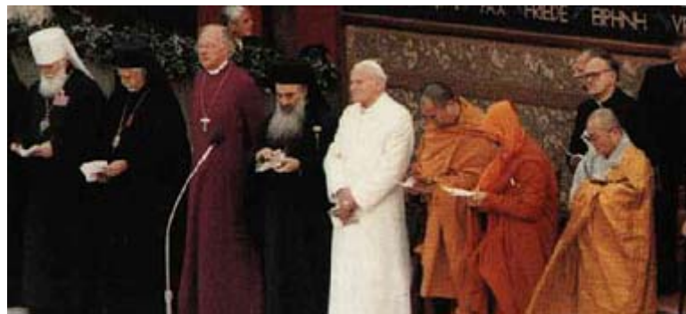
Interreligieuze bijeenkomst in Assisi (okt. '86)

Zelf zou ik in een dialoog met andere godsdiensten eerder uitgaan van de spreuk die de huiskamer van de Noord Amerikaanse padres in Livingston (een haventje in het Guatemalteekse Q’eq’chi-Maya-gebied) siert: “Wie in contact komt met andere culturen, doet liefst zijn schoenen uit, want hij staat op heilige grond. Wie geen rekening houdt met de religieuze gevoelens van die mensen, vertrapt hun heiligste dromen. En het is nog erger, als hij ook nog vergeet of zelfs niet gelooft dat God daar al eerder was”.