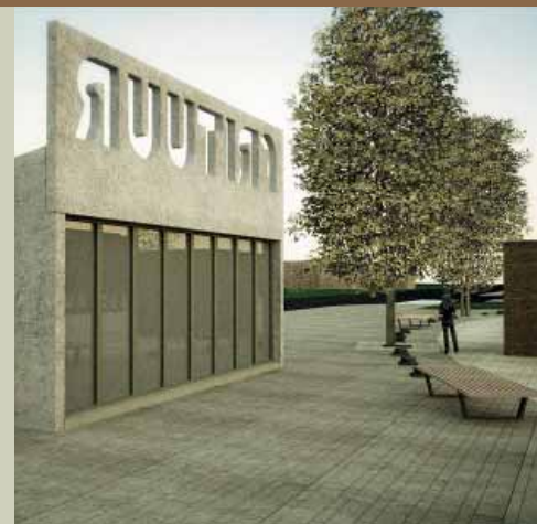
Zo zal de nieuwe frituur er uitzien.

Intussen schiet ook de bouw van het nieuwe politiebureau flink op. Het is de verwachting dat het nieuwe hoofdkwartier, waar zo'n 95 politiemensen en administratieve personeelsleden zullen werken, volledig klaar zal zijn tegen eind mei 2008. Vervolgens dienen nog organisatorische werken verricht te worden zoals de installatie van het hele telefonie- en computernetwerk. De verhuis van de inspecteurs zelf is voorlopig voorzien voor de week van 22 september. Nog wat later op dit jaar