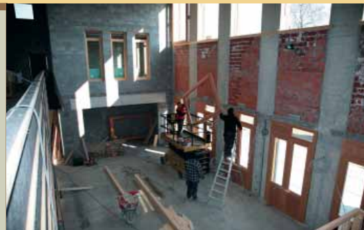
Dit binnenzicht geeft een goed beeld van welke imposante afmetingen het politiebureau in wording heeft.

Lijn 780 die vanuit Wijnegem komt en richting Brasschaat rijdt, maakt een flinke omweg. In de Theofiel Van Cauwenberghslei slaat de bus immers niet de Kruispadstraat in. Ze rijdt wel via de Paalstraat, Kuipersstraat, Vordensteinstraat, RWV Havrelaan en Jozef Jennesstraat om pas dan weer uit te komen op de vertrouwde route in de Paalstraat, ter hoogte van Bloemendaal.