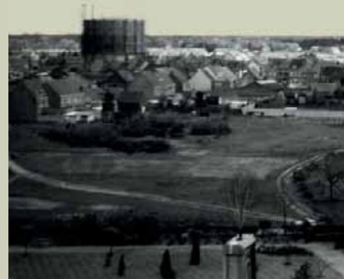
De grote Gasketel domineerde jarenlang de 'skyline' van Schoten.

Het Gasketelplein ontleent haar naam aan de imposante installatie die decennialang heel Schoten bevoorradde met energie. De ketel werd in 1973 afgebroken. Enkele jaren geleden kocht de gemeente de terreinen over van de gasmaatschappij. De bodem werd gesaneerd met het oog op de herbestemming tot dorpsplein en politiebureau.